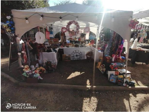
Notre stand au marché de Noël d'Aubais